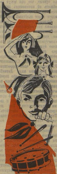
Рис. Сергей АНТОНОВА.